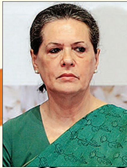
ਸ਼੍ਰੀਮਤੀ ਸੋਨੀਆ ਗਾਂਧੀ