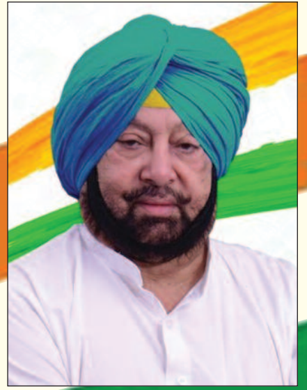
ਕੈਪਟਨ ਅਮਰਿੰਦਰ ਸਿੰਘ

ਪੰਜਾਬ ਕਾਂਗਰਸ ਦੇ ਧੜਲੇਦਾਰ ਲੀਡਰ ਕੈਪਟਨ ਅਮਰਿੰਦਰ ਸਿੰਘ ਦੀ ਅਗਵਾਈ ਵਿਚ ਪੰਜਾਬੀਆਂ ਵੱਲੋਂ ਕਾਂਗਰਸ ਪਾਰਟੀ ਨੂੰ ਦਿੱਤੇ ਭਰਪੂਰ ਫਤਵੇ ਲਈ ਕੋਟਿ-ਕੋਟਿ ਧੰਨਵਾਦ