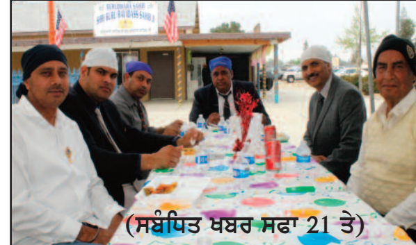
(ਸਬੰਧਿਤ ਖਬਰ ਸਫਾ 21 ਤੇ)