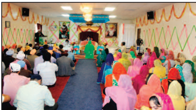
ਸ੍ਰੀ ਗੁਰੂ ਰਵਿਦਾਸ ਸਭਾ ਸੇਲਮਾ ਨੇ ਮਨਾਇਆ ਸਤਿਗੁਰੂ ਰਵਿਦਾਸ ਜੀ ਦਾ 640ਵਾਂ ਪਾਵਨ ਪੁਕਾਸ ਦਿਹਾੜਾ। ਰਿਪੋਰਟ ਤੇ ਤਸਵੀਰਾਂ ਦੇਖੋ ਸਫਾ 21 ਅਤੇ 23 'ਤੇ