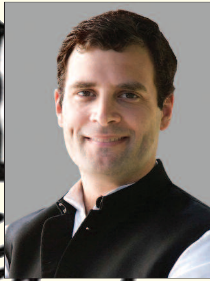
ਸ਼੍ਰੀ ਰਾਹੁਲ ਗਾਂਧੀ