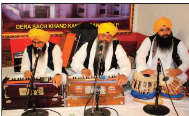
ਸ੍ਰੀ ਗੁਰੂ ਰਵਿਦਾਸ ਟੈਂਪਲ ਯੂਥਾ ਸਿਟੀ ਦੀ 11ਵੀਂ ਵਰ੍ਹੇਗੰਢ ਸ਼ਰਧਾ ਅਤੇ ਉਤਸ਼ਾਹ ਨਾਲ ਮਨਾਈ ਗਈ। ਰਿਪੋਰਟ ਤੇ ਤਸਵੀਰਾਂ ਦੇਖੋ ਸਫਾ 11 ਤੋਂ 14 ਤੱਕ