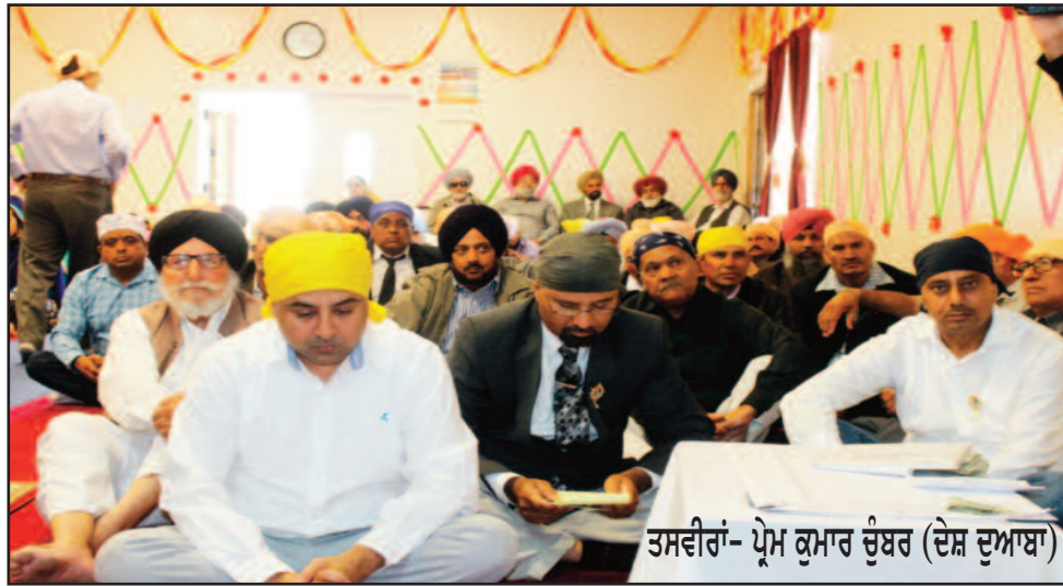
ਤਸਵੀਰਾਂ- ਪ੍ਰੋਮ ਕੁਮਾਰ ਚੰਬਰ (ਦੇਸ਼ ਦੁਆਬਾ)